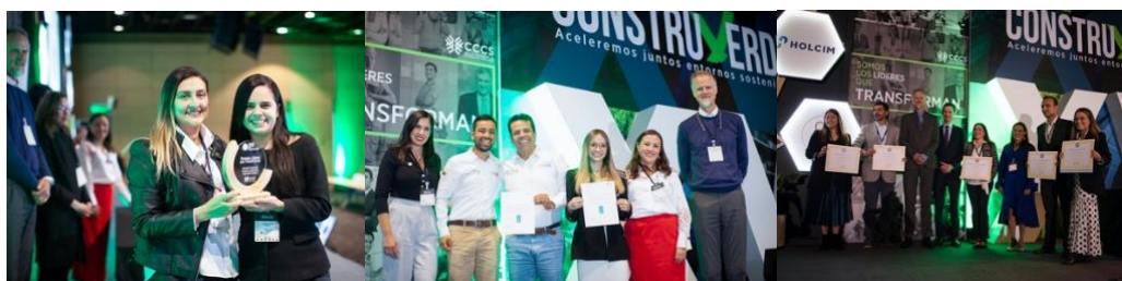
Premios Líderes que Transforman, Distinciones CASA Colombia y Distinciones LEED.