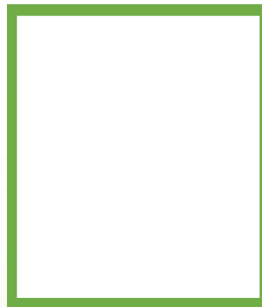
PÁGINA IMPAR 23 x 27,5 cm Caja tipográfica: 20 x 25,5 Sangrado: 5 x 5 mm