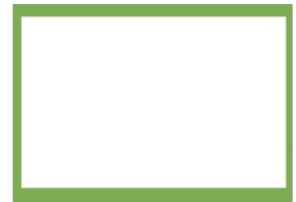
½ PÁGINA IMPAR HORIZONTAL 20 x 11,75 cm Sangrado: 5 x 5 mm