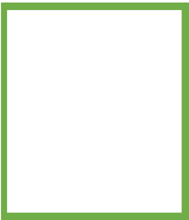
PRIMERA PÁGINA 23 x 27,5 cm Caja tipográfica: 20 x 25,5 Sangrado: 5 x 5 mm